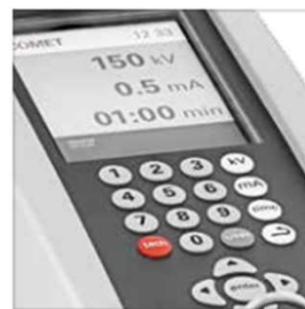
6.5インチ カラーディスプレイ