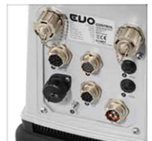
アクセスしやすい コネクタ