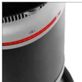
視認性の良い ワーニングライト