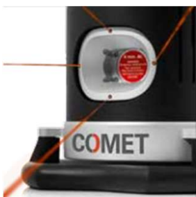
X線ビーム レーザーインジケータ