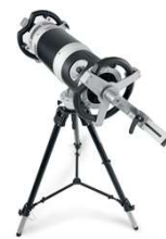
チューブスタンド